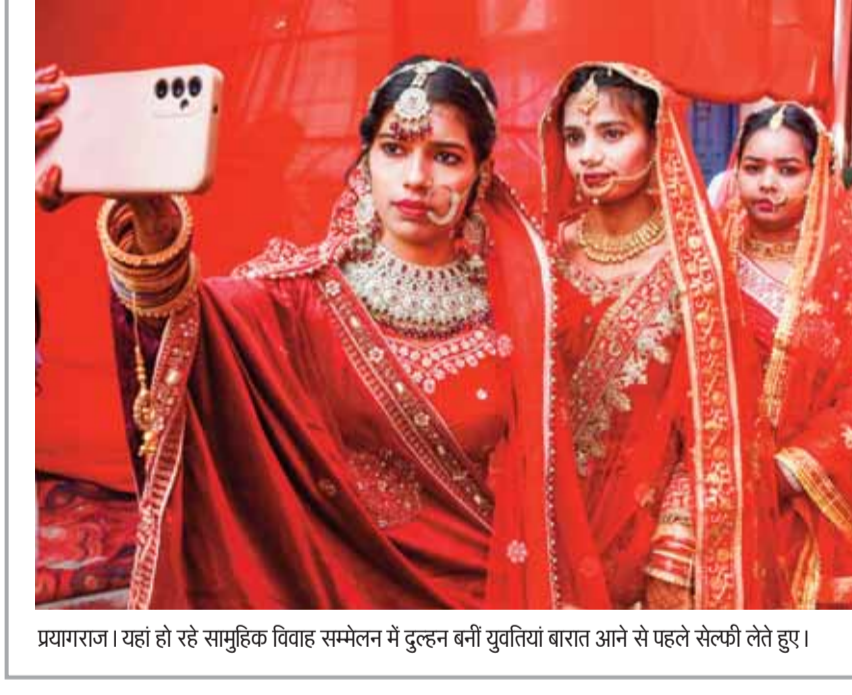
प्रयागराज। यहां हो रहे सामूहिक विवाह सम्मेलन में दुल्हन बनीं युवतियां बारात आने से पहले सेल्फी लेते हुए।