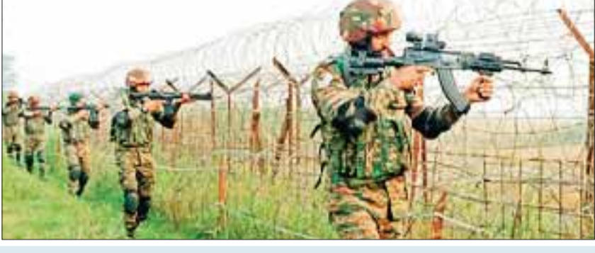
फोर्स ऑपरेशन सिंदूर 2.0 के लिए तैयार : इससे पहले 30 नवंबर को जम्मू के बीएसएफ कैम्प में एनुअल प्रेस कॉन्फ्रेंस आयोजित की गई थी। इस दौरान बीएसएफ की जम्मू फ्रंटियर के एलजी शशांक आनंद ने बताया, 'साल 2025 में अब तक बीएसएफ ने पाकिस्तान की 118 चौकियां तबाह की हैं। सरकार ने हमें जीरो घुसपैठ का टारगेट दिया है। हम उसको पूरा करेंगे।'

8 को सेना ने मार गिराया आईजी अशोक यादव ने बताया कि अब घुसपैठ के प्रयासों में काफी कमी आई है। इस साल कश्मीर फ्रंटियर में 13 आतंकों ने घुसपैठ की चार कोशिशें कीं। सेना ने आठ को मार गिराया, पांच भाग गए। उन्होंने बताया कि घुसपैठ का पैटर्न एक जैसा है, मगर हाल के दिनों में आतंकों ने नए स्ट्रेटजी की कोशिश की है। इनपुट के आधार पर सेना और बीएसएफ उन पर नजर रख रही है। सेना और पुलिस मिलकर कर रही काम कश्मीर घाटी में बीएसएफ की 13 कंपनियां सेना और पुलिस के साथ मिलकर काम कर रही हैं। आईजी ने आतंकों की गुपचुप भर्ती पर चिंता जताई, जो कट्टरपंथियों के सेंटर के तौर पर काम कर रहे हैं। उन्होंने बताया कि आतंकों के लिए जिम्मेदार एजेंसियों को अटक भेजा जाता है और सुरक्षा बलों के बीच पूरी तालमेल है।